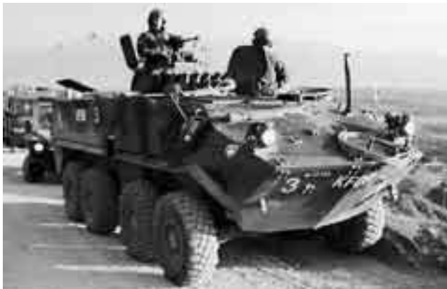
Bestgeschütztes und kampfkraftigstes Einsatzmittel der Swisscoy im Kosovo: Der Piranha.

wurden dazu Radschützenpanzer Piranha entsandt. Zumindest der Sicherungszug (seit kurzem zwei Züge, resp. aufgrund der Verlagerung der Einsatzaufgaben in Richtung Sicherung eine Infanteriekompanie) kann sich seither splittergeschützt verschieben und auch Konvois als Schutzelement begleiten.