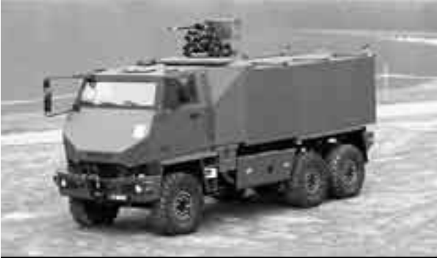
Geschütztes Mannschaftstransportfahrzeug der DURO-Fahrzeugfamilie (GMTF).

Die Schweizer Armee ist grundsätzlich – was gepanzerte Fahrzeuge betrifft – noch auf passablem Weg. Es gilt, trotz einschränkendem finanziellem Spielraum auf keinen Fall den Anschluss zu verpassen und sich dabei von wenig fundierten, politisch motivierten Ablenkungsmanövern nicht davon abbringen zu lassen. Das bedeutet, dass nach erfolgter flächendeckender Ausrüstung der Infanterie mit splittergeschützten Fahrzeugen die Ausrüstung des mechanisierten Aufwuchskerns mit Gefechtsfahrzeugen der nächsten Generation (inkl. APS-Schutz) rechtzeitig ins Auge gefasst und umgesetzt werden muss.