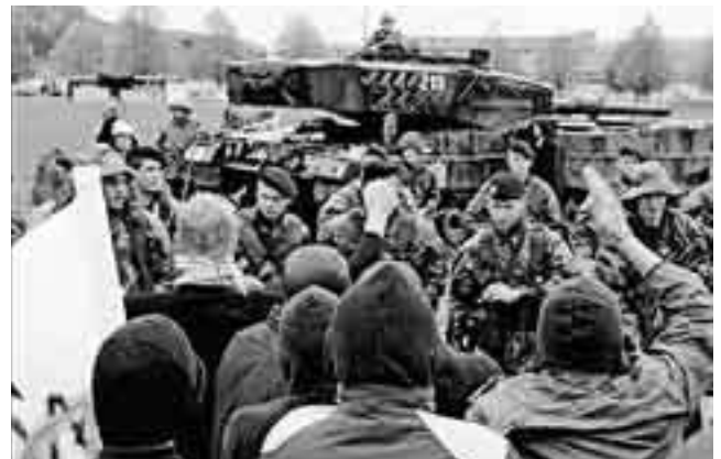
Einsatz von Kampfpanzer Leo II anlässlich der Übung Zeus der Inf Br 2 im Mai 06.

Die Schlagzeile unserer Boulevardzeitung zur Übung Zeus lautete dementsprechend unreflektiert: « Beim Zeus! Armee jagt Terroristen durch die Westschweiz » (Blick 9.5.2006). Das Schlagwort Terrorismus ist denkbar ungeeignet, um den Fächer an möglichen Bedro-