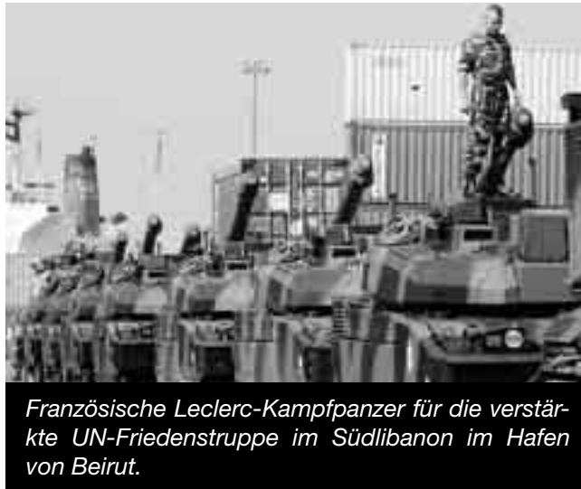
Französische Leclerc-Kampfpanzer für die verstärkte UN-Friedenstruppe im Südlibanon im Hafen von Beirut.

Aber auch die deutsche Bundeswehr, die politisch bedingt eine eher passive Rolle im verhältnismässig ruhigen nördlichen Teil Afghanistans wahrzunehmen