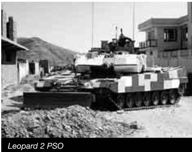
Leopard 2 PSO

Bei Marktreife muss auch die Anschaffung eines aktiven Schutzsystems geprüft werden, und zwar für alle mittelschwer- und schwerkgepanzerten Fahrzeuge. Des Weiteren müssen genügend Kampfpanzer modularartig den Anforderungen von friedensfördernden Einsätzen angepasst werden. Vorbild dabei ist die Weiterentwicklung Leopard 2 PSO (Peace Support Operation): Zusätzliche Schutzelemente an Turm und Fahrgestell, ein Räumschild, zusätzliche Bordwaffen, Beobachtungsmittel und Kamerasystem zur Rundumüberwachung, Schutz der Optiken und ein Aussenanschluss für die Bordverständigungsanlage, zur direkten Kommunikation mit den abgesehenen Einheiten. 6