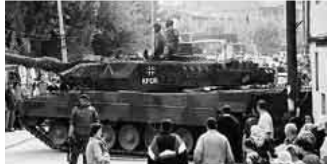
Kampfpanzer Leopard der Bundeswehr im Kosovo.

Bericht des Verbands österreichischer Blauhelme anlässlich der Balkanreise im Jahr 2004.