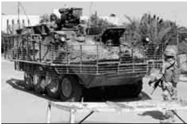
Stryker-Gefechtsfahrzeug im Irak mit «Käfig», der Hohlladungsgeschosse vorzeitig zur Explosion bringen soll.

zeug, dem Stryker. Der Stryker ist bekannterweise eine Entwicklung der Schweizer Firma MOWAG auf Basis des Piranha III. Das Fahrzeug mag sich durch seine ausserordentliche Mobilität im eigentlichen Irakkrieg (Operation Iraqi Freedom) bewährt haben. In den nachfolgenden Raumsicherungsoperationen zeigte sich allerdings, dass das Basisfahrzeug des Stryker keinen genügenden Rundumschutz bieten konnte. Die grösste Gefahr drohte durch ab Schulter eingesetzte RPG 7 (Rocket Propelled Grenade)-Panzerfäuste und improvisierte Sprengladungen jedweder Grösse. Zur Abwehr der Raketengeschosse mit Hohlladungen wurde die Schutzwirkung der Stryker durch zusätzliche Panzerung und einen Metallkäfig, der Hohlladungsgeschosse vor dem Aufschlagen auf die eigentliche Panzerung vorzeitig zum Explodieren bringen soll, deutlich verbessert. Die Gewichtserhöhung von mehreren Tonnen und die grösseren Masse durch das mitgeführte Metallgitter haben indessen eine verminderte Mobilität des Fahrzeuges zur Folge.