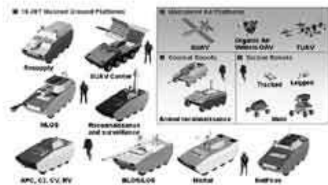
Future Combat System der US-Army – unterschiedliche Fahrzeuge basierend auf derselben Fahrzeugfamilie.

Die USA arbeiten bereits heute an einem zukünftigen Gefechtssystem (Future Combat System, kurz FCS). Die Hauptmerkmale dieses Systems sind: Fähigkeit auf höchstem Grad zur Vernetzten Operationsführung, eigene diversifizierte Aufklärungsmöglichkeiten (unbemannt zu Land und Luft) sowie hohe Feuerüberlegenheit (direkt und indirekt). Dabei wurde der Panzerung in der bisherigen Planung zugunsten der Mobilität weniger Beachtung geschenkt, und man gab sich mit geringeren Schutzstufen zufrieden. Die Gewichtsgrenze von maximal 18–20 Tonnen sollte die Lufttransportfähigkeit mit Transportflugzeugen und eine hohe Mobilität garantieren. Das Manko der Panzerung hätte durch hochwertige Aufklärung, das APS und die Vernetzte Operationsführung kompensiert werden sollen. Aber auch hier kann davon ausgegangen werden, dass die Entwickler aus den momentanen Einsatzerfahrungen im Irak die Konsequenzen ziehen werden. Es ist zu erwarten, dass die FCS-Fahrzeugfamilie mit einer stärkeren als der ursprünglich geplanten Panzerung produziert werden wird. Bezüglich Lufttransportfähigkeit wird man auf die grössere C-17 Globemaster III heavy cargo aircraft ausweichen.