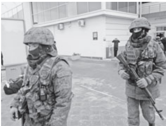
Soldaten unbekannter Herkunft in Simferopol

Für Zündstoff in Europa sorgte die russische Annexion der Krim im Jahre 2014. Die ukrainischen Bemühungen, eine Annäherung an Europa und die NATO zu erreichen, wusste Russland durch Unterstützung von separatistischen Kräften in der überwiegend russischsprachigen Ostukraine und der Entsendung bewaffneter «Freiwilliger» zu verhindern. Diese Vorgehensweise hat die übersättigten und seit den 90er-Jahren in einer Abrüstungsspirale befindlichen europäischen Regierungen überrascht und führte schliesslich zu anhaltenden Spannungen in Osteuropa. Als Reaktion verstärkte die NATO ihre Präsenz im Baltikum und in Ostpolen – mehr mit medial wahrnehmbaren Truppen und Luftwaffenstationierungen, denn mit ernst zunehmender Anwesenheit schlagkräftiger Verbände. Die NATO, deren Existenzrecht durch die kollektive Verteidigung gegeben ist, signalisiert dadurch, dass jede Aggression gegen ein NATO-Mitglied inakzeptable Kosten verursachen würde 2 . Russland rüstete seinerseits sein Waffenarsenal unter anderem in Kaliningrad auf. Die russische Exklave – eingeschlossen von Lettland, Polen und der Ostsee – gilt als militärisch am dichtesten gerüstete Gegend in Europa. 3