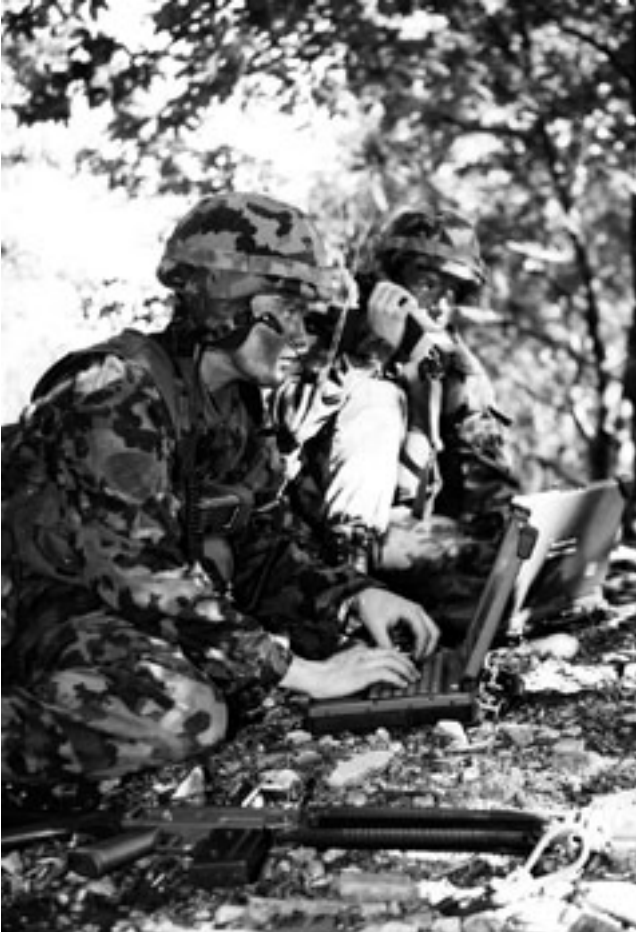
Hervorragend ausgebildete Milizarmee: Minenwerfer koordinieren das Feuer mittels Feuerleitrechner.

Einsatzarmeen unterhalten, sind heute gezwungen, sich mit diesen Tatsachen auseinanderzusetzen. Gut möglich also, dass sich der Trend im nächsten Jahrzehnt noch verstärkt.