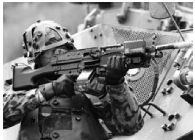
Füsilier mit leichtem Maschinengewehr: Unsere Soldaten sind für den härtesten Einsatz bereit. Aber sie brauchen das notwendige Material.