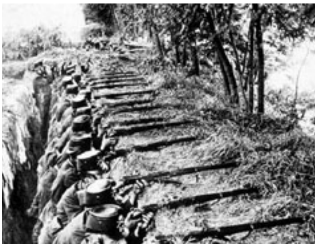
Hohe Bereitschaft: Füsiliere in Stellung während des Ersten Weltkrieges.

Im Gegenzug ist zu erwähnen, dass die zunehmende Technologisierung und Professionalisierung gerade auch den Berufsarmeen immer mehr Schwierigkeiten bereiten. Es ist teurer, IT-Kompetenzen aufzubauen und mittels marktgerechten