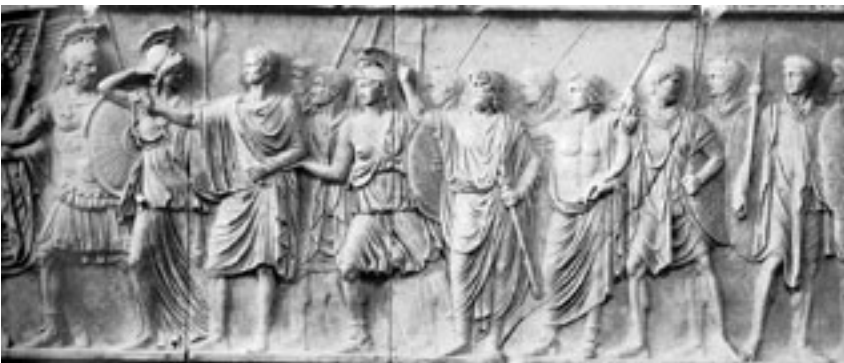
Ungeahnte Folgen durch Heeresreform: Römische Legionäre, Bürger und Gottheiten auf dem Cancelleria-Relief, Rom, ca. 90 n.Chr.

Im 20. Jahrhundert stiegen viele grosse westliche Staaten nach dem Zweiten Weltkrieg wieder