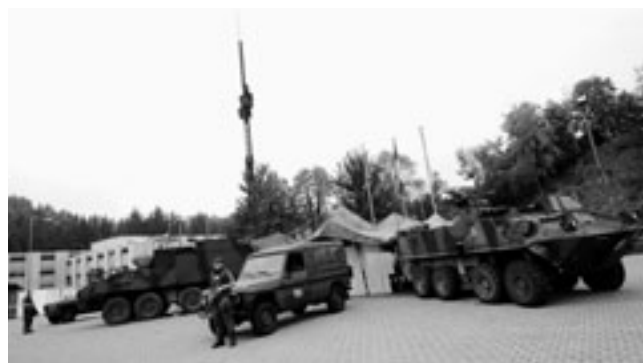
Militärische Führungsausbildung: Unter schwierigsten Bedingungen planen und führen können.

Grundlage bildet eine im Jahr 2008 durchgeführte Befragung bei einem Infanteriebataillon der Schweizer Armee. Die Daten wurden im Rahmen eines Wiederholungskurses erhoben und anschliessend elektronisch erfasst. Für die Auswertung standen die Antworten von 380 Bataillonsangehörigen (Soldaten, Unteroffiziere und Offiziere) zur Verfügung. Es werden zwei Populationen unterschieden: einerseits Soldaten und andererseits militärische Kader, also Offiziere und Unteroffiziere. Kader unterscheiden sich von den Soldaten dadurch, dass sie zusätzlich zur Grundausbildung eine militärische Weiterbildung absolviert haben. Die Kernfrage «Haben Personen mit einer militärischen Weiterbildung beruflich einen Vorteil oder einen Nachteil?» wird quantitativ und qualitativ beantwortet. Einerseits wird eine Regressionsanalyse auf Basis der soziodemografischen und berufsspezifischen Informationen durchgeführt. Das verwendete Regressionsmodell basiert auf einer Mincer-Lohnleichung (Mincer, 1974), welche mit Variablen zur Kaderposition, Branche, Unternehmensgrösse, Berufserfahrung sowie mit Angaben zur zivilen Weiterbildung und mit soziodemografischen Merkmalen der Personen ergänzt wurde. Da die Lohninformation nur in Lohngruppen zur Verfügung stand, wird