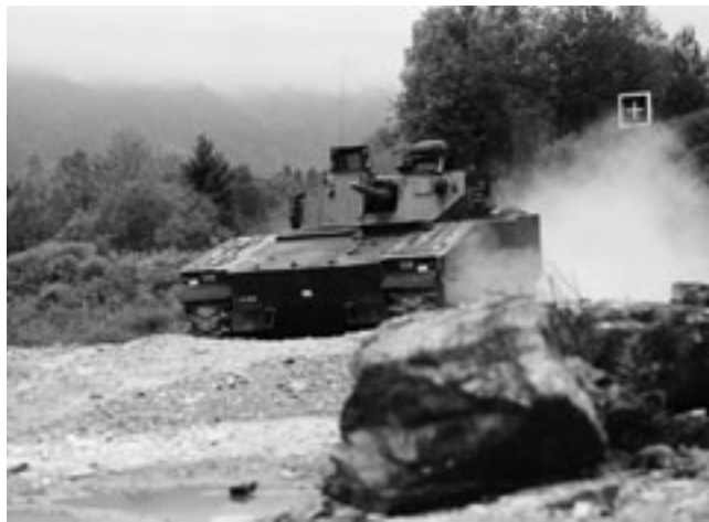
Schützenpanzer 2000: Schutz, Mobilität und Waffenwirkung sind die Prämissen für unsere Milizsoldaten.

Nur mit den drei Prämissen «bessere Führung und Planung», «mehr Kompetenz und Eigenverantwortung für die Miliz» und «mehr Mittel» lässt sich die riesige Herausforderung, vor der die Sicherheitspolitik und die Armee stehen, überhaupt bewältigen.